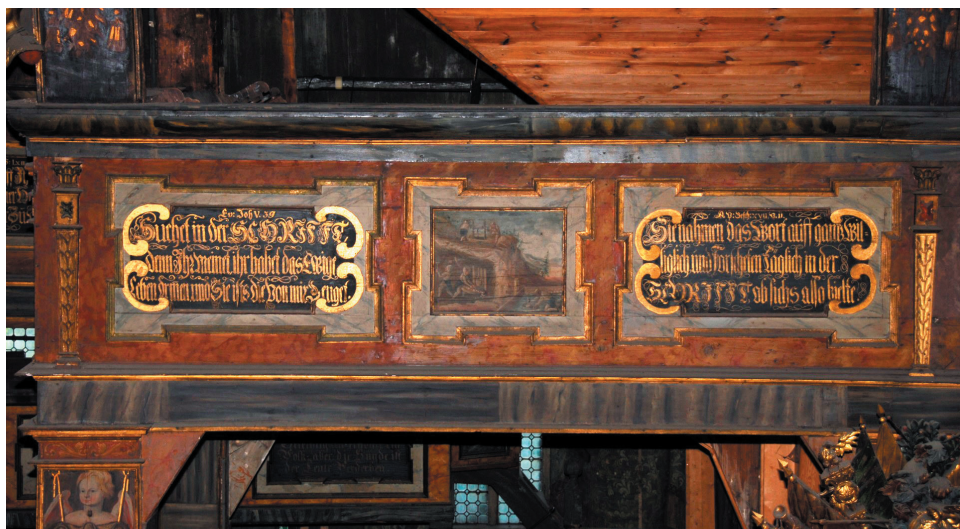
Ryc. 2. Fragment balustrady empyry – w środku płyцина z obrazem kopalni

gich i niepiśmiennych), wprawdzie nietypową, gdyż znajdują się tu również teksty. Nasuwa się myśl, że obraz mógłby być powiązany z jednym z tekstów znajdujących się na sąsiednich płycinach (ryc. 2).