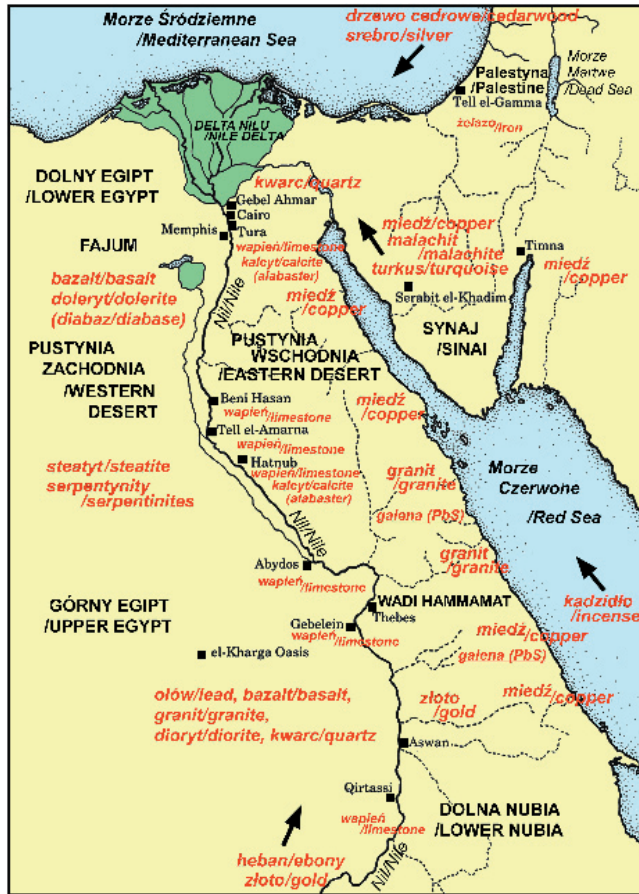
Ryc. 1. Schematyczna mapa zasobów mineralnych Egiptu