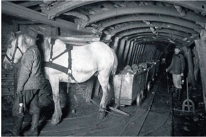
Ryc. 3. Transport urobku (Bansen, 1921)