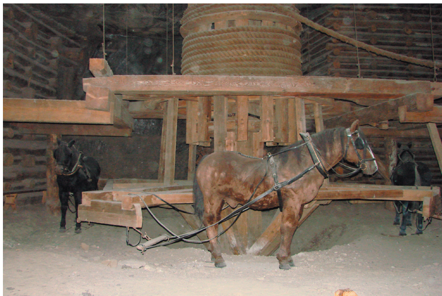
Ryc. 6. Konie w kieracie, rekonstrukcja w Kopalni Soli „Wieliczka”