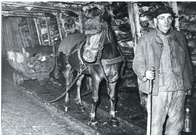
Ryc. 4. Transport materiałów do przodka (Gisman, 1950)

Konie w kopalni traktowane były przez górników zawsze z szacunkiem. Dla odpoczynku posiadały one stajnię na podszybiu (ryc. 5). Przystosowane do tego celu wyrobisko miało odpowiednią wentylację i odwodnienie spągu. Wyrobisko było murowane, a ściany wyłożone były płytkami ceramicznymi. Żłoby dla pojenia i kar-