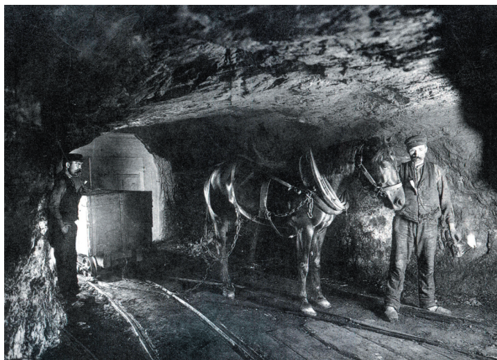
Ryc. 2. Konny zaprzęg w kopalnianym przewozie, kop. Hohenzollern Szombierki (Steckel, 1898)

Praca koni na dole kopalni przyczyniała się do wzrostu wydobywania po wprowadzeniu filarowego systemu eksploatacji. Koń, oprócz przewozu urobku z przodka